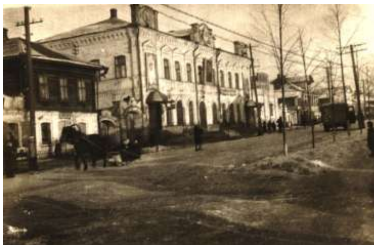
Рис. 3. Дом купца А. Созыкина (ул. Кирова, 7) и Андриянова (ул. Кирова, 9) Фото 1930-х годов.