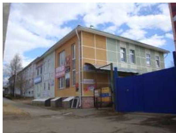
Рис. 6. Здание по улице Ленина, 38 после реконструкции