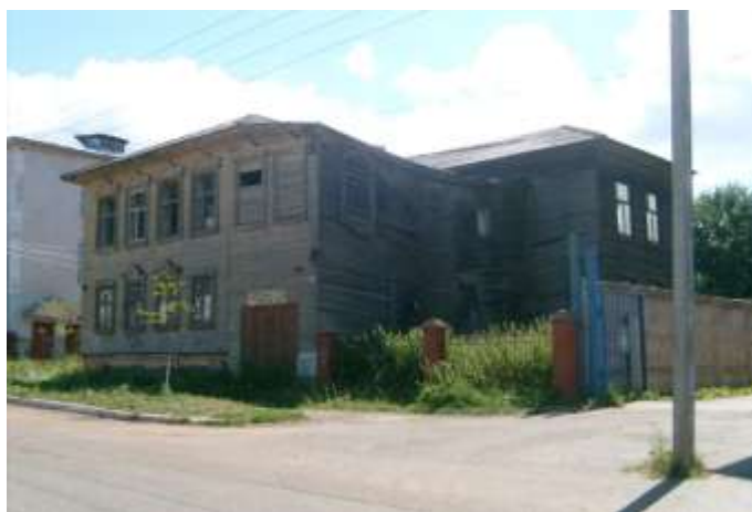
Рис. 5. Здание женского Некрасовского училища по Поповской улице (Ленина, 38)