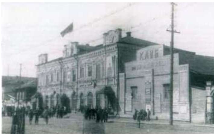
Рис. 2. К дому Андриянова (ул. Кирова, 9) пристроен клуб имени В.И. Ленина Фото 1930-х годов.